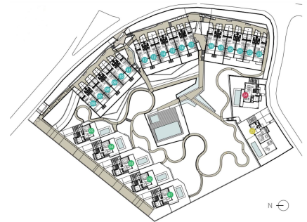
3 Bedroom Townhouse at La Vera de Marbella, Eivissa