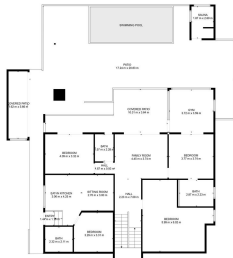
TOTAL 393.02 Netto-Graaf: 12.00 m 2 (12.00 m 2 ), 10.00 m 2 (10.00 m 2 ) INSLUUDDE WAAK- en OORVERDEKING: 14 m 2 , 14 m 2 , 14 m 2 (14 m 2 ) BOPPERDEKING: 18 m 2 , 18 m 2 (18 m 2 )